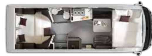
Aantal slaappleatsen: 4