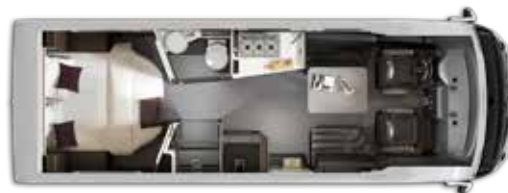
Aantal gehomologeerde zitplaatsen: 4