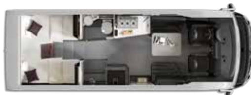
Aantal gehomologeerde zitplaatsen: 4