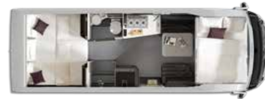
Aantal slaappleaatsen: 4+1