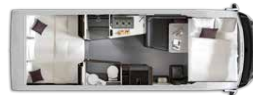
Aantal slaapplekken: 4+1