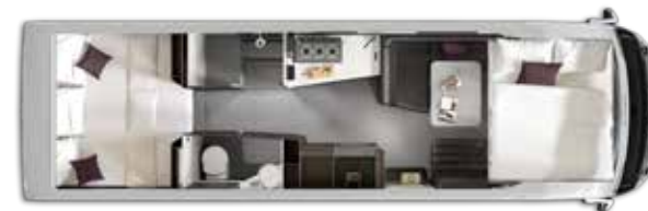
Aantal slaapplaatsen: 4+1