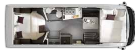
Aantal slaappleaatsen: 4