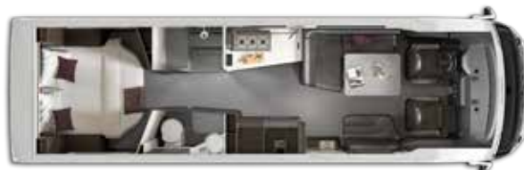
Aantal gehomologeerde zitplaatsen: 4