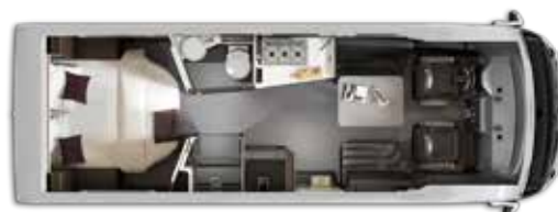
Aantal gehomologeerde zitplaatsen: 4