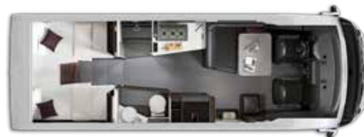
Aantal gehomologeerde zitplaatsen: 4