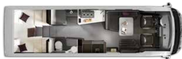
Aantal gehomologeerde zitplaatsen: 4