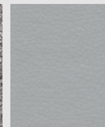
OPTIE voor alle leder en textiel combinaties.