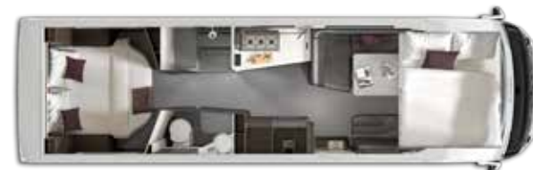
Aantal slaapplaatsen: 4